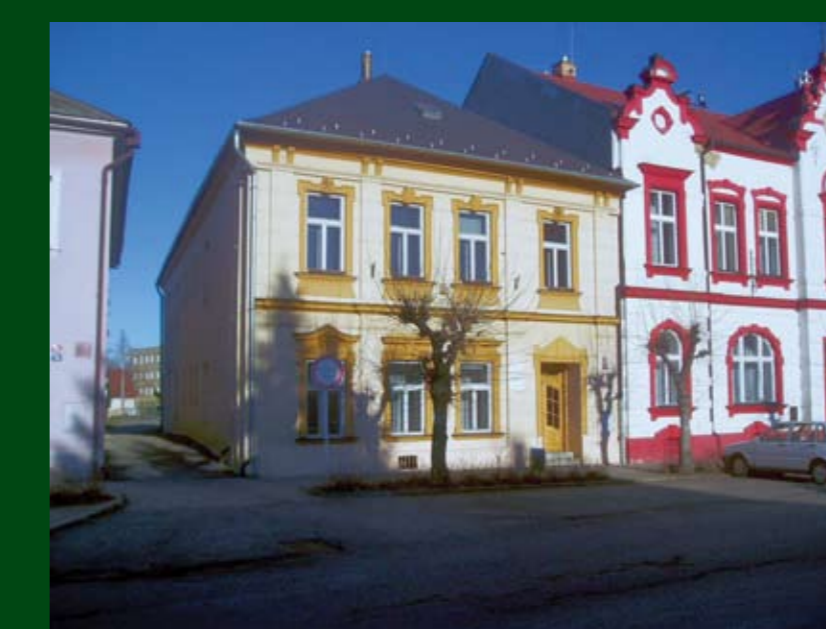
Budova sídla lesní správy na náměstí v Městě Albrechticích vedle Městského úřadu

Jméno a kontakt na toho „Vašeho“ revírníka vám sdělí lesní správce v sídle LS v Městě Albrechticích na tel. 554 653 151 nebo e-mailové adrese ls101@lesy.cz. Základní údaje o státním podniku LČR nebo o kterékoliv jeho organizační jednotce najdete na internetových stránkách www.lesy.cz.