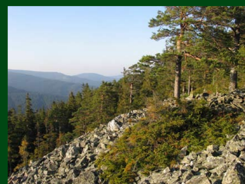
Borovice na suti v přírodní rezervaci Suchý vrch

Na severní polokouli roste víc jak 100 druhů borovice. Kromě borovice lesní se na Krnovsku můžeme setkat v lesích vzácně s borovicí černou a borovicí vejmutovkou, ovšem jen uměle vysazenou. Další druhy borovic se běžně pěstují v parcích.