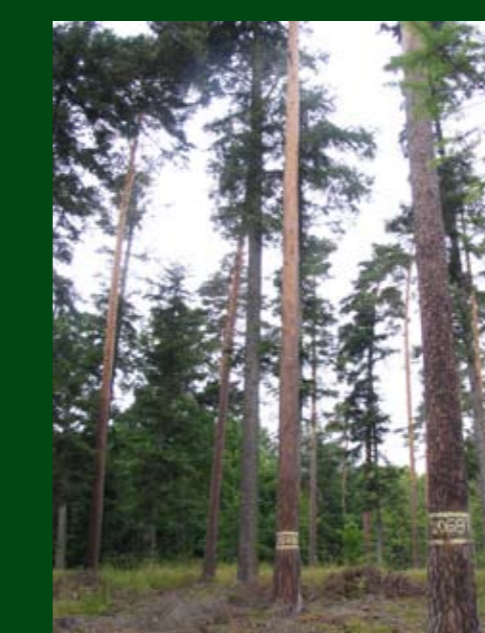
Borovice označeny pro sběr roubu

Nejkvalitnější borovice se trvale označí žlutými pruhy a číslem a využívají se jako zdroj roubu pro zakládání semenných sadů. (viz foto)