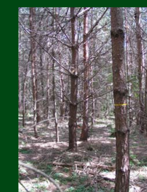
Označení nadějných stromů

Na Třeboňsku se z borového dřeva dlouho máčeného ve vodě štípou dlouhé tenké „proutky“, ze kterých se dělají velmi odolné košíky.