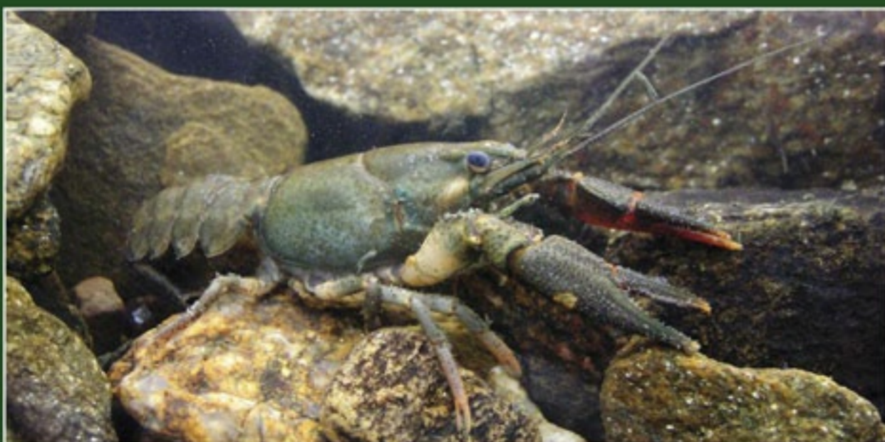
Rak říční; foto František Bárta

Hedvíčkovská rokli je součástí národní přírodní rezervace a evropsky významné lokality Lichnice – Kaňkovy hory. V centrální části zvané Peklo se rokli dělí na dvě části. Základem údolí bylo v geologické minulosti původní koryto řeky Chrudimky. Rokli dnes protéká Zlatý potok a jeho pravostranný přítok Starodvorský či Pekelský potok. Na migmatitech až pararulách vystupujících na povrch se v období čtvrtohor uplatnilo mrazové zvětvávání, díky kterému byly vymodelovány strmé skalní stěny s krátkými mírně skloněnými terasami, tzv. mrazové sruby, či izolované skalky, tzv. tory. V zachovalých lesních porostech je dominantní dřevinou buk lesní. Listnaté a smíšené lesy s jedlí, smrkem a bukem bývaly ještě před 200 lety pro Železné hory typické. Staré bučiny obývá lejssek malý, na skalních výchozech pravidelně hnízdí vyr velký, v potoce žije rak říční a občas loví vydra říční. Na skalách je hojný vřes obecný.