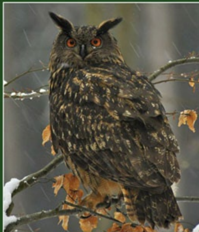
Vyr velký; foto Michal Pešata