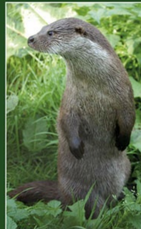
Vydra říční