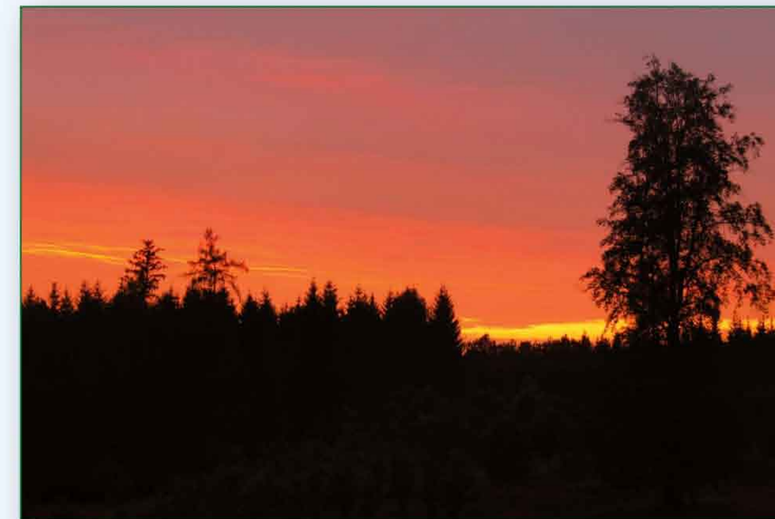
Zapadající slunce nad oborou