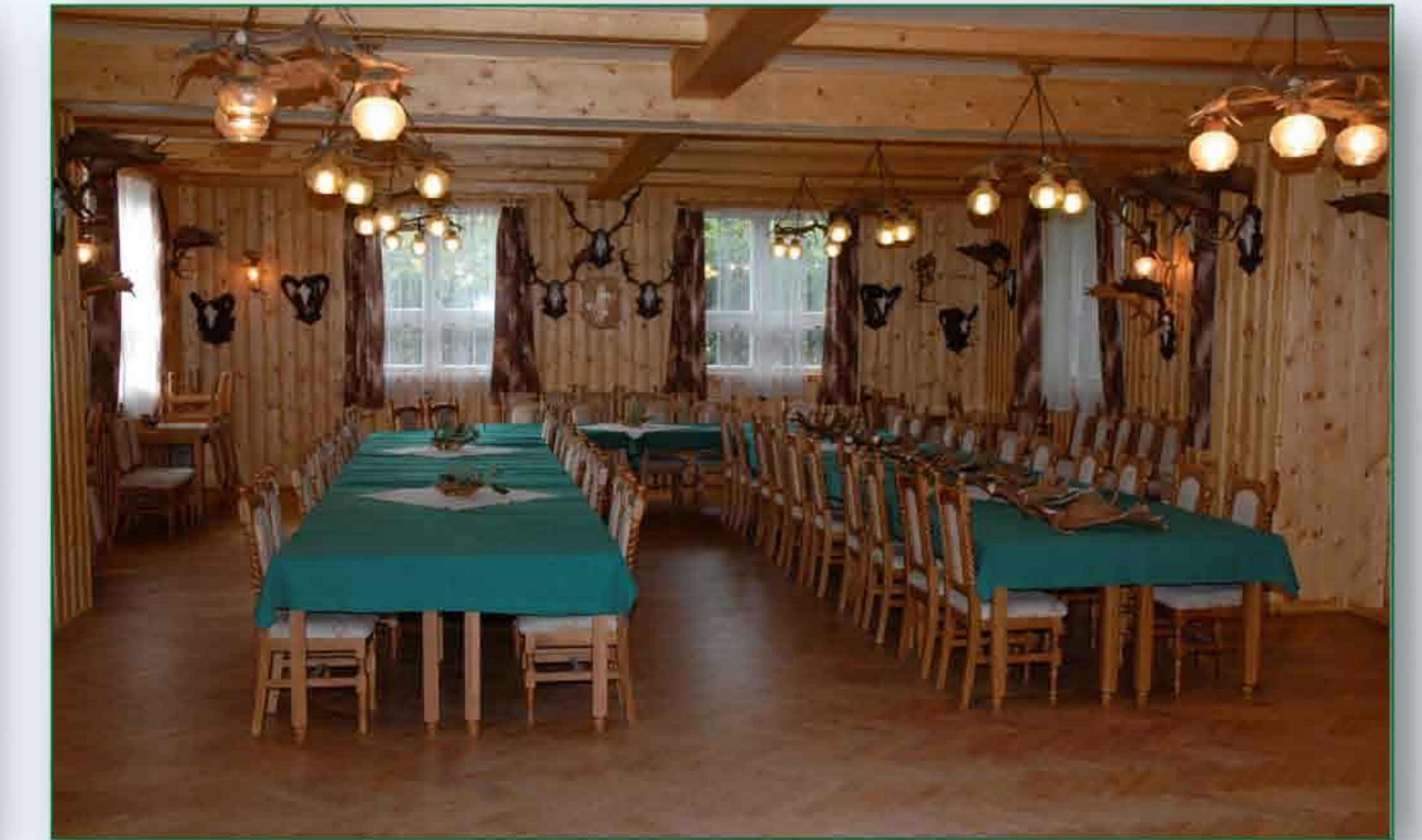
Interiér lovecké chaty