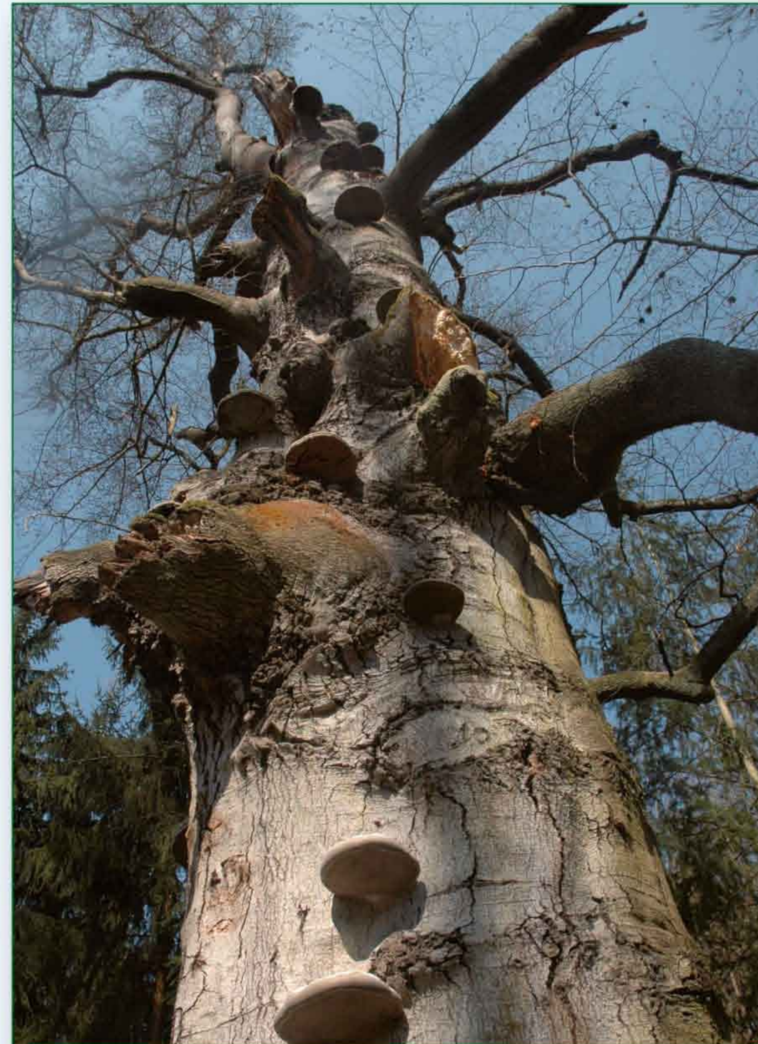
Ze starých stromů zde dýchá historie tohoto kraje