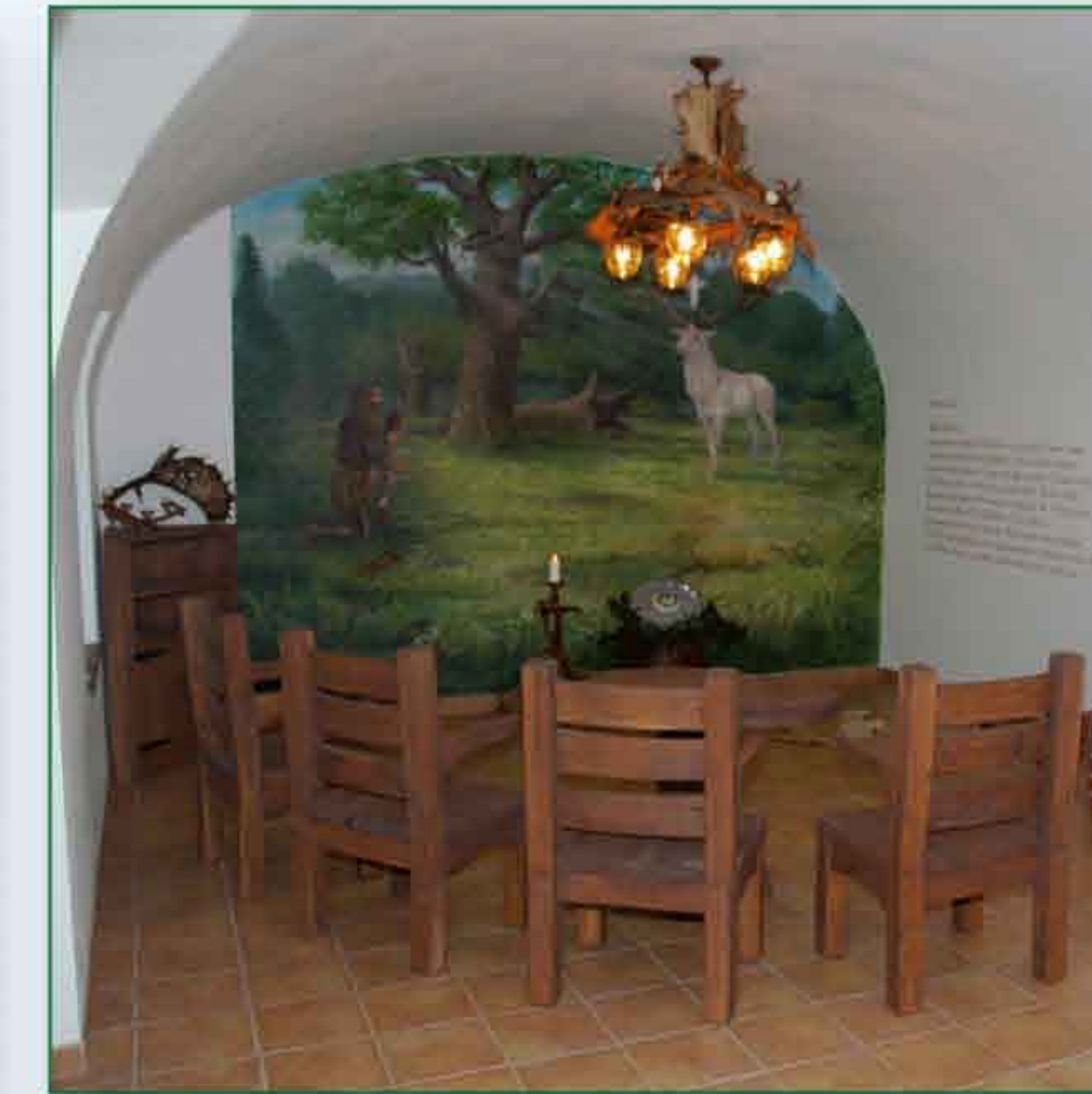
Stylové posezení u Svatého Huberta na revíru Stará Obora