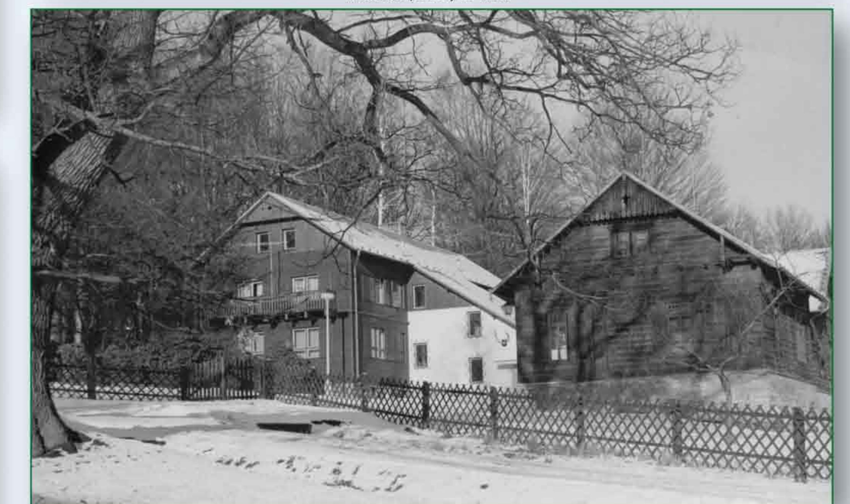
Historické pohledy na chatu