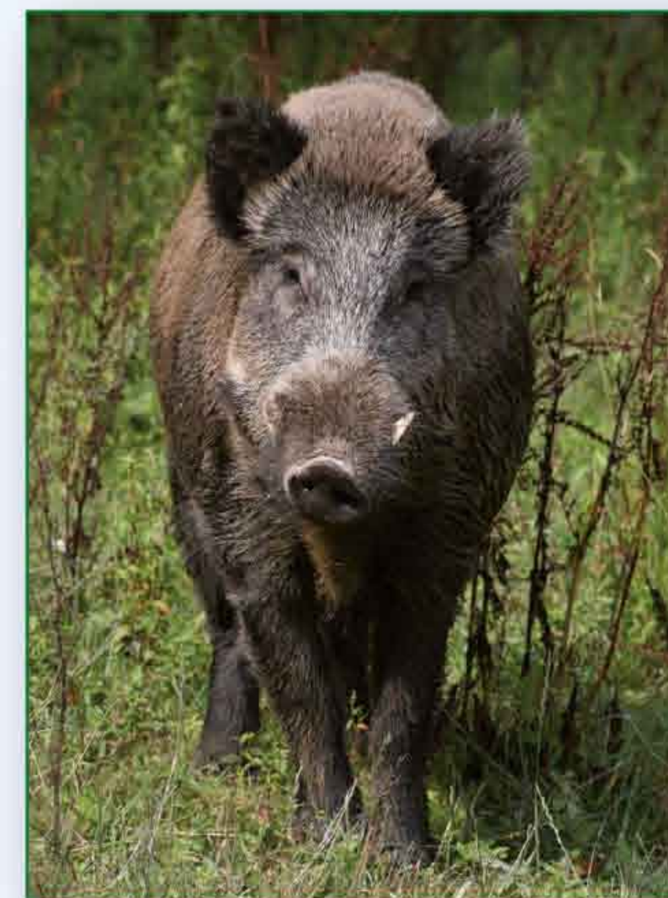
V oboře žijí silní kňouři