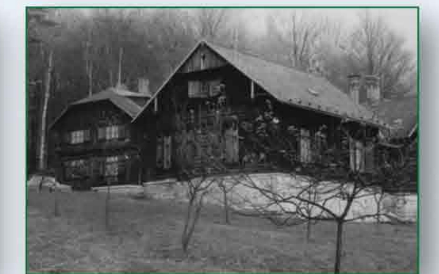
Historické pohledy na chatu