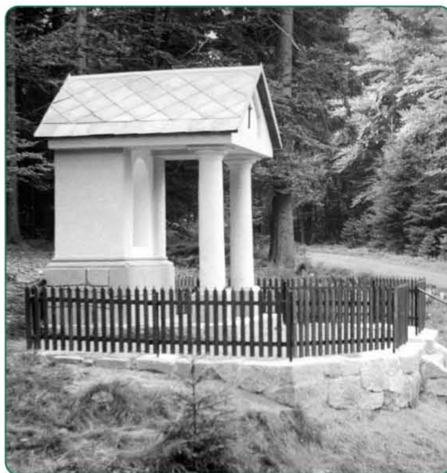
vlevo: Opravená kaplička - Kapelle nach der Wiederherstellung vpravo: Vyobrazení kaple před opravou - Abbildung der Kapelle vor der Renovierung