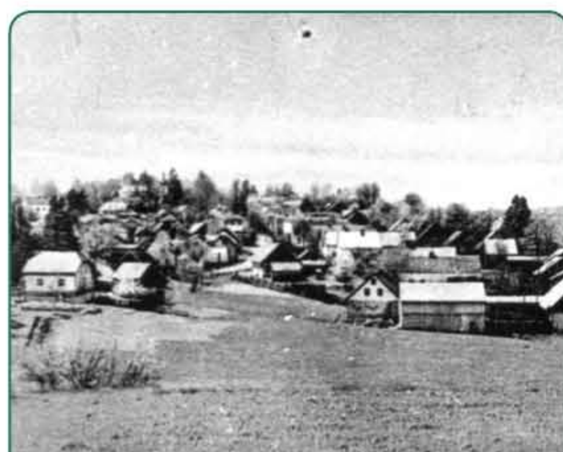
Lesná na staré pohlednici