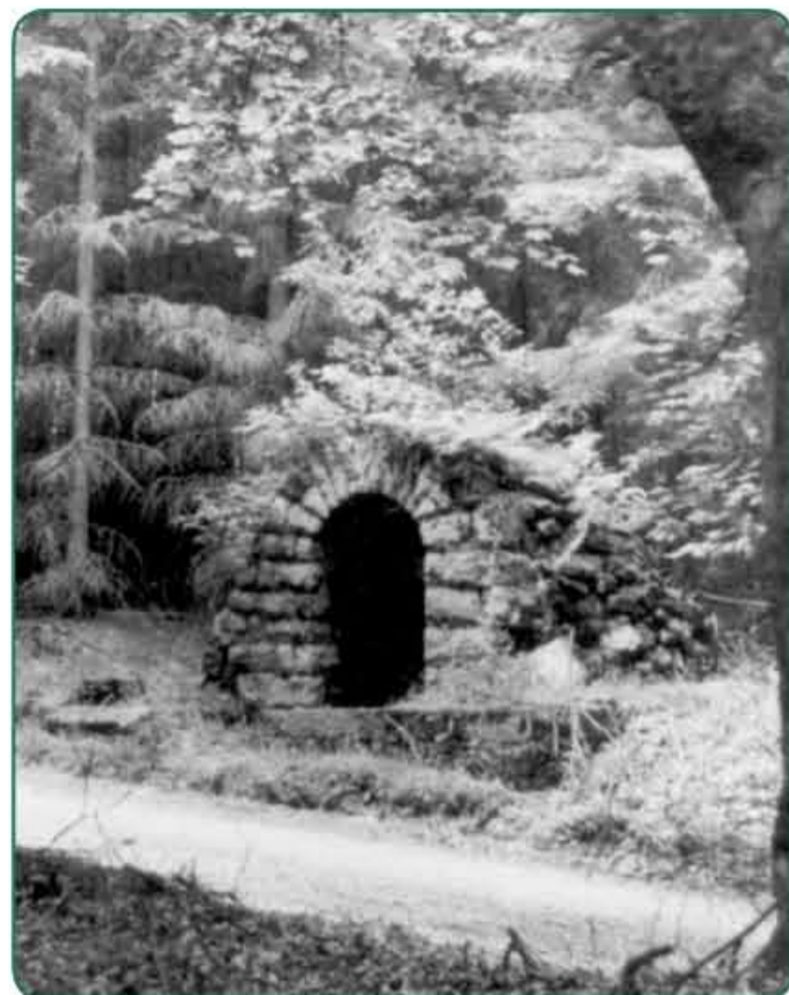
Kolmská kaple – Kolmer Kapelle