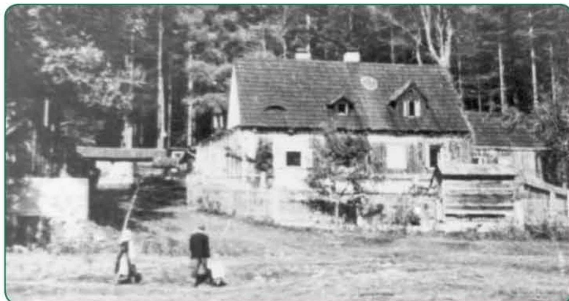
Bývalá lesovna v 1. polovině 20. století a její zříceniny dnes