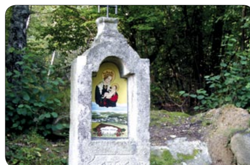
4c – Boží muka na Pošláku Bildstock in Poschlag / Pošlák (Výšina)