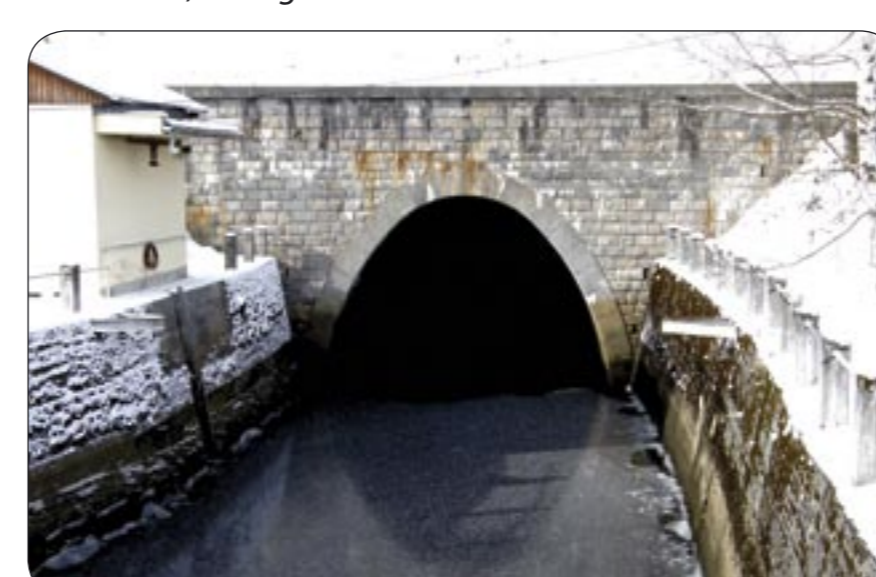
4f – Vyústění tunelu dnes Tunnelauslauf, heutiger Zustand

Text: Miroslav Kubišta, překlad do němčiny: Jiří Franc