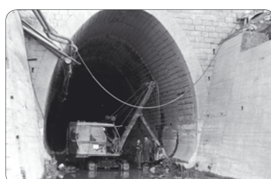
4f – Dostavba odpadního tunelu Fertigstellung des Abflusstunnels