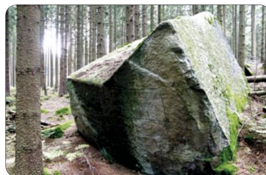
4d – Balvan s nápisem na Vyklestilce Felsblock auf dem Berg Wikleskirche / Vyklestilka