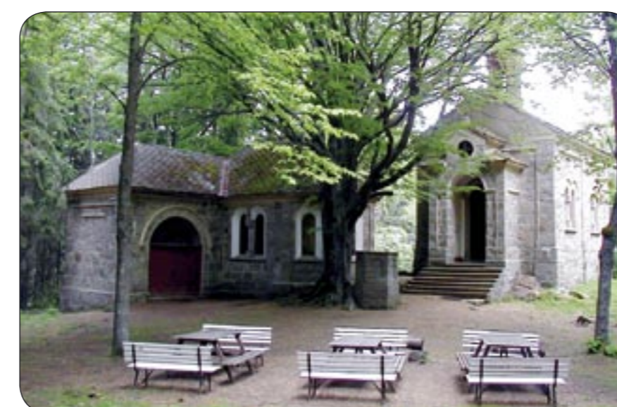
4e – Maria Rast dnes Maria Rast, heutiger Zustand