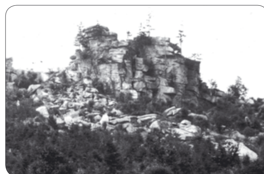
4b – Mrazový srub na Vyklestilce „Frosthütte“ auf dem Berg Wikleskirche / Vyklestilka