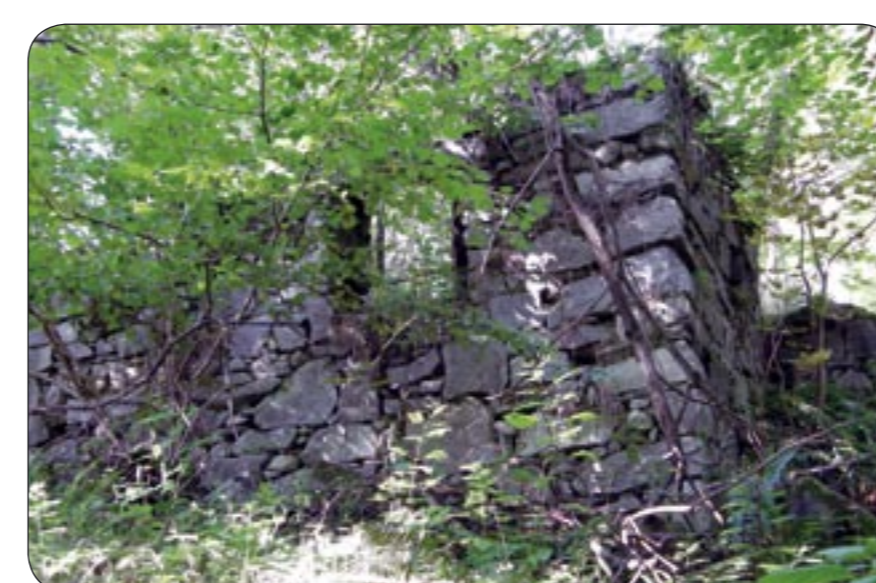
4a – Zbytky domu na Pošláku Hausreste in der ehem. Gemeinde Poschlag