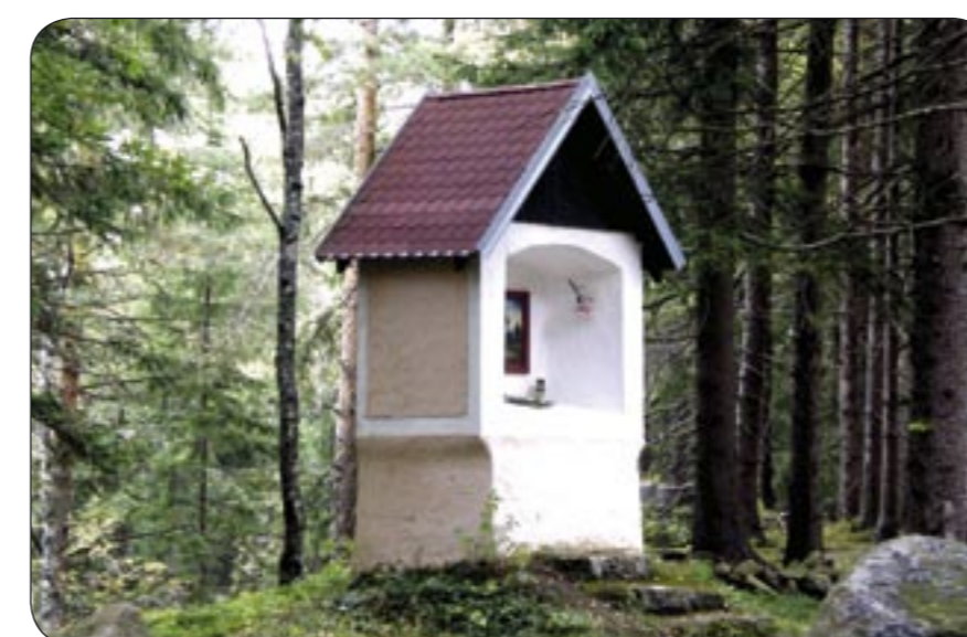
4c – Kaplička pod Vyklestilkou Martel an Fuße des Bergs Wikleskirche / Vyklestilka