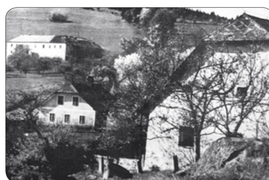
4a – Bývalá obec Pošlák Ehem. Ortschaft Poschlag

4f – TUNEL. Při stavbě Lipenské přehrady byla v hloubce 160 metrů pod povrchem vybudována podzemní hydroelektrárna. Voda využitá k výrobě elektrické energie odtéká z této elektrárny odpadním tunelem o průměru 7,5 m a délce 3,6 km vylámaným ve skále. Tunel se začal razit roku 1952 od Vyššího Brodu a v roce 1955 ještě ve druhém směru od Lipna. Raziči se při maximálních denních výkonech 5,80 m setkali před půlnocí z 10. na 11. ledna 1956. Tento tunel se nachází asi 1300 metrů odtud severním směrem, kde se nad levým břehem Vltavy zvedá do výšky 933 m n.m. hora Luč (dříve Hirschberg – Jelení hora). Voda využitá k výrobě elektrické energie protéká tedy na své cestě od přehradní hráze Lipno I nejen pod celou touto horou, ale i pod samotnou Vltavou a skalnatým výběžkem s Čertovou stěnou. Vyústění tunelu do vyrovnávací nádrže Lipno II u Vyššího Brodu se nachází v průmyslovém areálu a není proto přístupné.