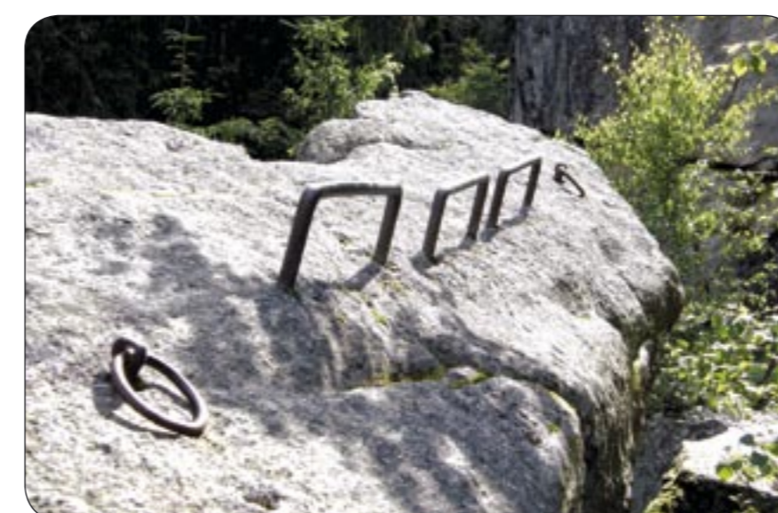
4b – Lezecké pomůcky na Vyklestilce Klettervorrichtung auf dem Berg Wikleskirche