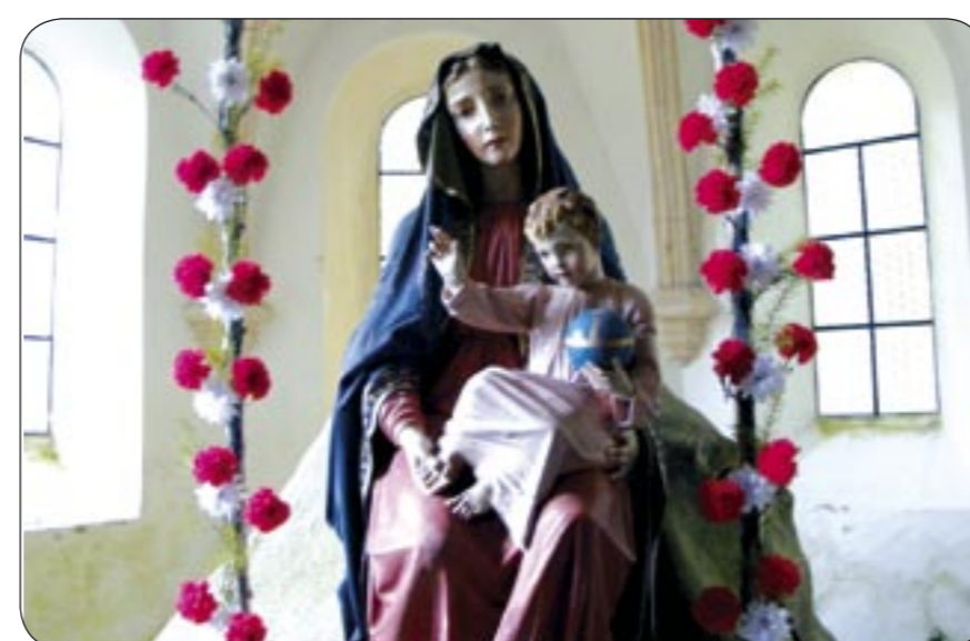
4e – Socha Madony s Ježíškem Gnadenstatue: Madonna mit Kind