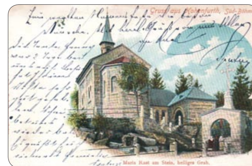
4e – Poutní místo Maria Rast Wallfahrtsort Maria Rast am Stein