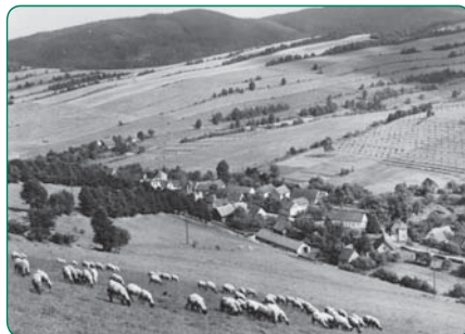
Obec Janov a Petrovice (70. léta minulého století)