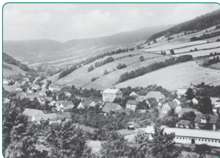
Obec Janov a Petrovice (60. léta minulého století)