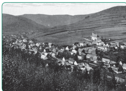
Obec Janov a Petrovice (asi r. 1900)