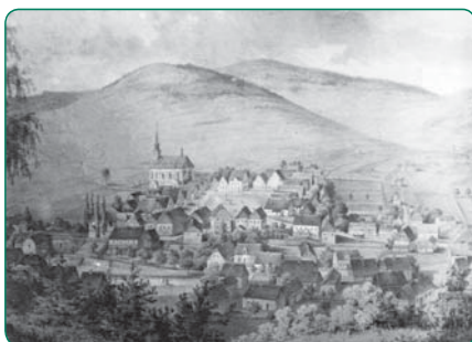
Obec Janov (1880)