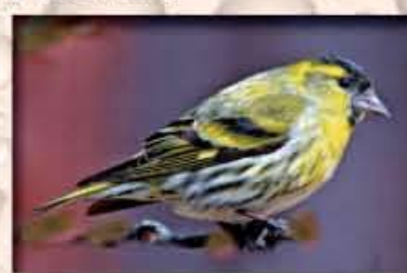
Čížek lesní ( Carduelis spinus )

Ačkoliv má národní přírodní památka poměrně malou rozlohu, bylo zde zaznamenáno mnoho druhů obratlovců i bezobratlých živočichů. Samozřejmě převládají druhy vázané na mokřadní prostředí, zejména obojživelníci a měkkýši z nichž někteří patří mezi ohrožené a chráněné živočichy. Zoologické průzkumy rezervace prokázaly mimo jiné výskyt 42 druhů ptáků a 99 druhů pavouků, což je úctyhodný počet. Ještě na přelomu 19. a 20. století se zde vyskytoval tetřev hlušec. Kromě běžně pozorovaných druhů sýkor do olšin často zalétá i čížek lesní . U vody můžete zahlédnout i výrazně žlutošedě zbarveného konipasa horského s dlouhým ocasem, kterým stejně jako jeho příbuzný konipas bílý, neustále nervózně pohybuje. Pokud zaslechnete prapodivné kvíčení z rákosových porostů u vody pak, pokud to zrovna nebude prase divoké, slyšíte chrástala vodního .