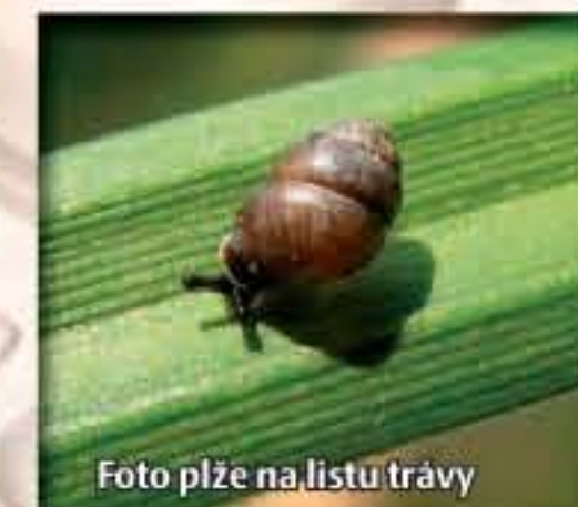
Vrkoč bažinný ( Vertigo moulinsiana ) je vzácný reliktní druh drobného plže (výška ulity se pohybuje kolem 2 mm), který je v celé střední Evropě na ústupu již od středního holocénu.

Zvláště chráněné území Rečkov bylo vyhlášeno již v roce 1949 pro ochranu mokřadních společenstev na rozloze 3,45 ha . V roce 2010 došlo v návaznosti na legislativu EU k vyhlášení území v nových hranicích a nyní Národní přírodní památka zaujímá cca 26 ha, včetně ochranného pásma. Hlavním předmětem ochrany bohatý porost postglaciálního reliktu, popelivky sibiřské ( Ligularia sibirica ), početná populace vrkoče bažinného ( Vertigo moulinsiana ) a také populace orchideje kruštiku bahenního ( Epipactis palustris ). (Glaciálním reliktem označujeme druh rostliny nebo živočicha, který se zachoval na malém území jako pozůstatek dřívějšího velkého rozšíření, změna jeho areálu je dána změnou klimatických podmínek v minulosti.)