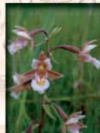
Kruštík bahenní ( Epipactis palustris )