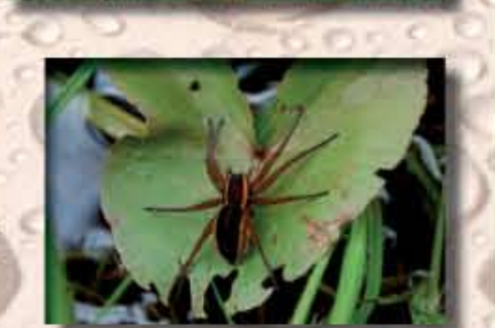
Lovčík vodní ( Dolomedes fibriatus )