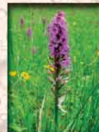
Prstnatec májový ( Doctylorhiza majalis )

V území nalezneme řadu vzácných především mokřadních druhů. Mezi nápadné patří orchidej kruštík bahenní , největší krasavec mezi našimi kruštiky, snadno poznatelný druh kvetoucí v červnu až v srpnu. V území se nachází i další druhy nápadné kvetoucí prstnatec májový či naopak druh s drobnými zelenými květy bradáček vejčitý . Z lesních společenstev převládají olšiny , z nelesních jsou významná slatinště, rákosiny a bezkolencové mokřadní louky . Různorodost biotopů nabízí „domov“ jak lesním tak i lučním druhům, čímž se výrazně zvyšuje biologická hodnota celého komplexu. Část biotopů je ukázkou tzv. sukcesní řady, kdy se louky postupně přeměňují v lesní porosty. Pokud se louky přestanou kosit, velmi rychle začnou zarůstat, nejčastěji rákosem, tím se výrazně sníží počet druhů, které ve stínu rákosu nejsou schopny dále existovat. Dále se začínou uchycovat dřeviny - nálet, keřové porosty. Postupně louky zarůstají náletem a nakonec se vytvoří olšina.