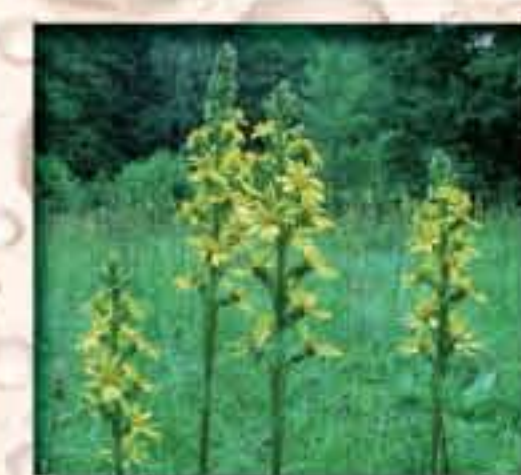
Popelivka sibiřská ( Ligularia sibirica ) z čeledi hvězdčovitých roste na slatinách, přechodových rašeliništích, mokřadních loukách, v řídkých rákosinách a v olšinách.