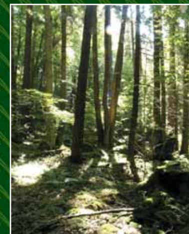
Stezka se vine bájnými královskými hvozdy.

Až zavítáte do tohoto malebného křivoklátského kraje, do míst, která byla právem vyhlášena biosferickou rezervací UNESCO, navštivte další zajímavé lokality: hrady Žebrák a Točnick, zříceninu hradu Týřov nebo opravdový turistický klenot Vraní skálu. Je to druhý nejvyšší vrchol v okolí, který je jednou z nejoblíbenějších lezeckých stěn a místem s nádherným kruhovým rozhledem do kraje.