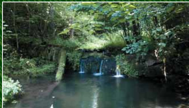
Na Lučním potoce jsou krásné a magické tůně, které lákají k zastavení.

Jak se tam dostat? Ke Stroupínskému mlýnu autem z dálnice D5, sjedete-li na exitu č. 28 Bavoryně,