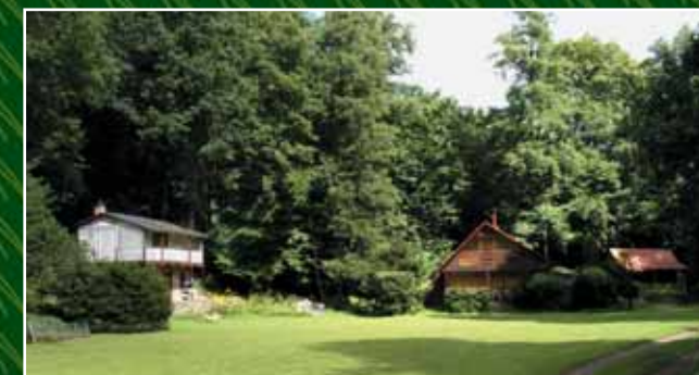
Chatová osada Ricatado na Pařezovém potoce.