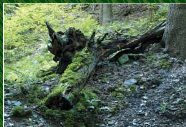
Na stezce narazíte na romantická zákoutí na každém kroku.

pokračujete na Hředle a dál na Březovou. Mlýn najdete na polovině cesty mezi těmito dvěma obcemi. Pokud zvolíte autobus, pojedete ze Žebráka na autobusovou zastávku na odbočce k obci Hředle.