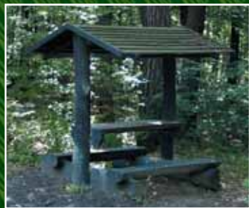
Na stezce jsou příjemná místa k odpočinku.

Pokud se rozhodnete navštívit naučnou stezku Údolí ticha, vězte, že se ocitnete ve skutečné přírodní oáze Křivoklátska. Je součástí Chráněné krajinné oblasti Křivoklátsko a má charakter přírodovědně naučné stezky. Na podmáčených půdách zde roste řada vlhkomilných rostlin a v okolí potoka se vyskytují vzácní a chránění živočichové.