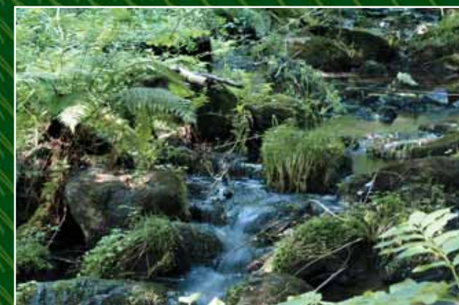
Luční potok si prorývá cestu kamenitým korytem s divokou flórou.