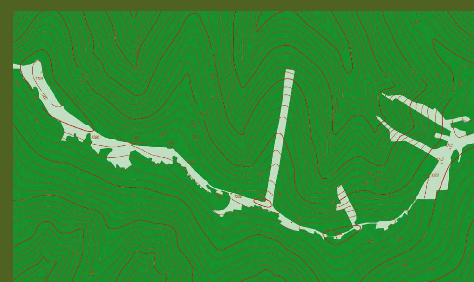
Dnes – pastviny, louky a jiné nelesní plochy

Hranice rožnovského a hukvaldského panství probíhala hřebenem Radhoště. Hukvaldské panství brzy pochopilo jaký význam bude mít dřevo pro začínající průmysl. Proto už od 18. století pastvu postupně omezovalo a vysazovalo nové lesy, až nakonec rozsáhlé pastviny na severní straně úplně zmizely.