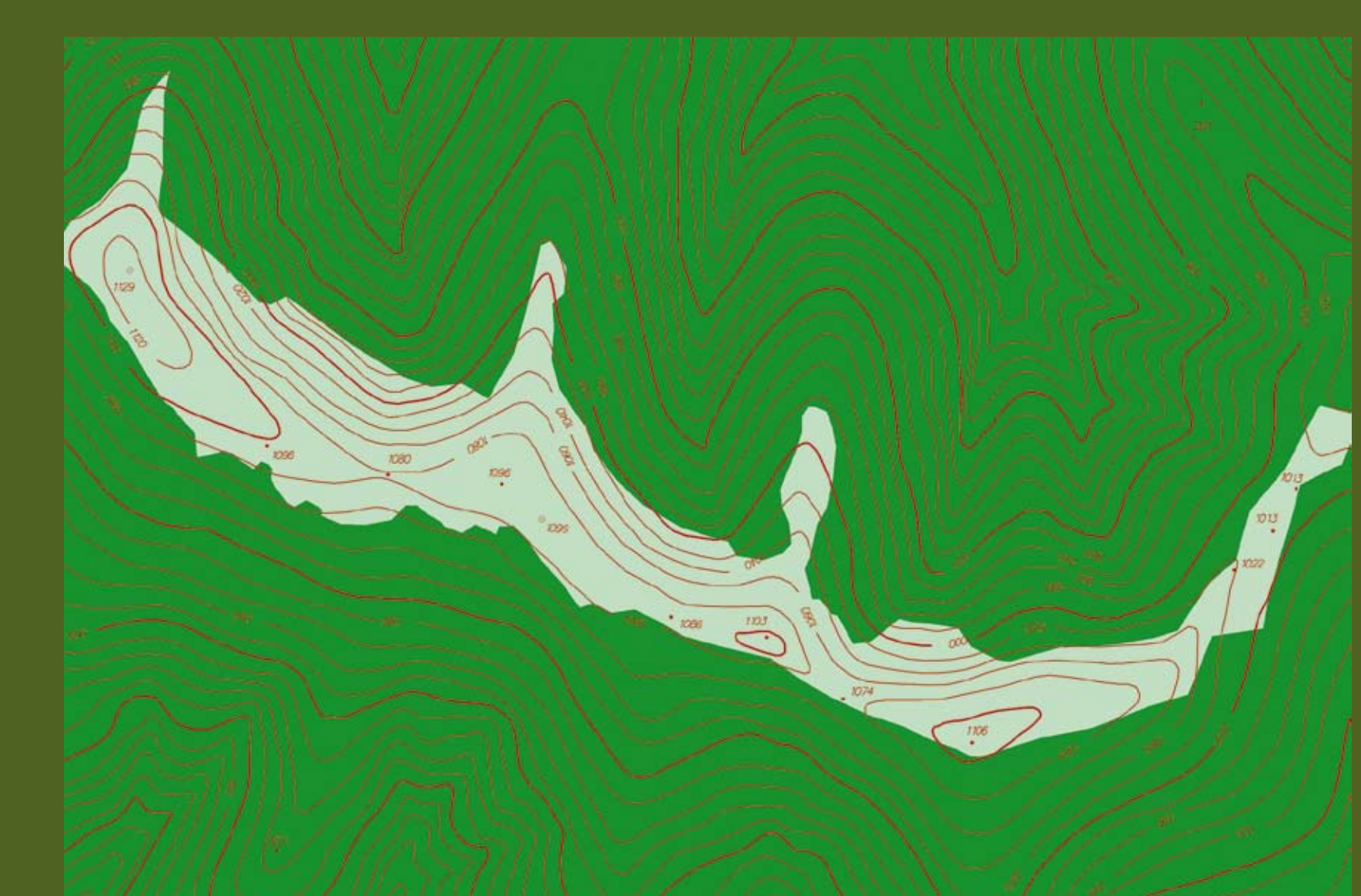
Před rokem 1830 – pastviny a řídké pastevní lesy na hřebeni Radhoště